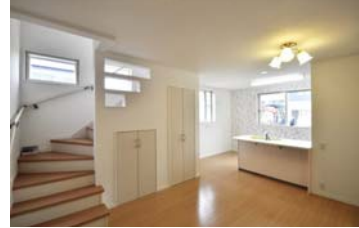
↑傾斜が緩やかになるように工夫された、リビング階段。階段を上がると、2階のホールへ。とても広々しています→