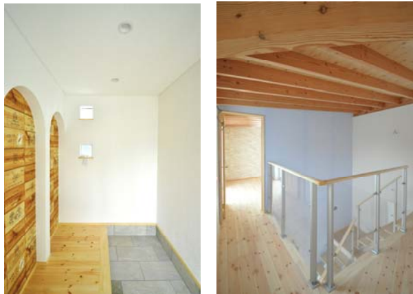
無垢の床材と塗り壁は、海と空の青に似合います。部屋全体がとても明るいですね。