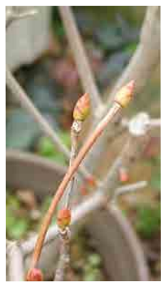
ドウダンツツジの新芽が膨らみ始めました【村瀬】

まだ肌寒い日が続いていますが、梅の花が咲いてきたり、花粉症の方は鼻がムズムズしてきたり、春が近づいてきましたね。今回はシンカのスタッフに春を見つけてきてもらいました！皆さんも私たちと一緒に春を見つけませんか？