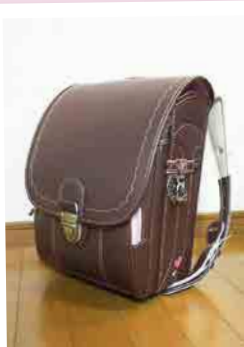
娘の入学ランドセル【出口】