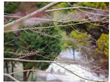
桜かな？梅かな？ ピンク色に色づく春見つけた！【神谷】