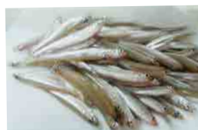
ワカサギが大量でした！ 天ぷらと南蛮漬け、 美味しかった♪【米子】