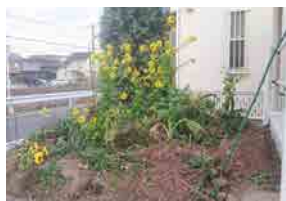
家の前の地下道にある花壇。先日改修工事の足場がとれたら菜の花が咲いていました。【古田】