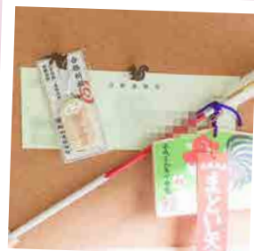
娘に春が来た。【宇野】