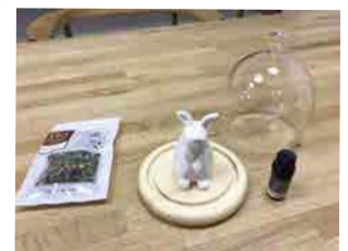
戸塚・花粉症緩和セット by 谷崎【戸塚】