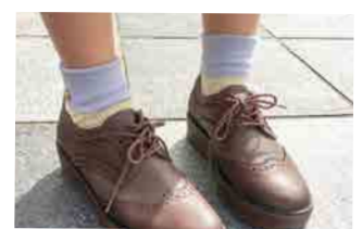
春に向けて靴下から衣替え【石川】