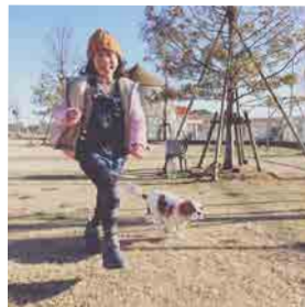
『ドッグラン』 木枯らしが吹いている頃はなかなか行けなかったけれどここ最近、犬も娘も私も元氣いっぱい走ってます【藤村】