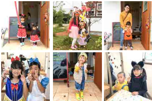
可愛い仮装をしてマルシェに来てくれた子供達 ★

後日、参加された作家さんとワークショップ・体験の先生、シンカスタッフで意見交換を行いました。「Instagramでつながっていた人たちと今回のマルシェで実際に会ってつながることができた。」「マルシェに来場された方がハンドメイドの楽しさを知るきっかけにしてもらえたら嬉しい。」「雨にもかかわらずたくさんの方に来ていただいて喜んでもらえた。」など、今回のマルシェの感想から次回のイベントの事など楽しくお話でき、有意義な時間となりました。