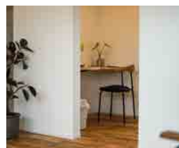
2畳のワークスペース。

【おすすめ観葉植物】パーガンディー 人気の高い観葉植物「ゴムの木」の仲間。 動きのある幹がアクセントの観葉植物です。 黒味がかっていて、重厚感があり大人の魅力を 感じます。耐寒性、耐陰性にすぐれ、 育てやすいためおすすめです!