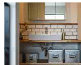
サブウェイタイル使用の洗面台。