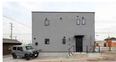
グレーの塗り壁を使ったシンプルな外観。