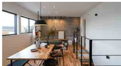
タイルの意匠壁がアクセントの2階リビング。