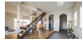
casa liniere / カーサリンネル 『リンネル』と建てる北欧テイストの家