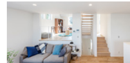
casa skip / カーサスキップ 家族がつながるスキップフロアの家