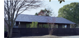
casa basso / カーサバスソ シンプルモダンを極めた平屋