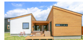
casa cago / カーサカーゴ 6畳のピースを組み合わせる家