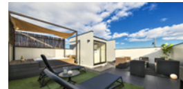
casa sky / カーサスカイ 屋上空間をデザインした家