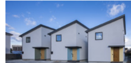
casa rozzo / カーサロッツォ “暮らし”を丸ごとパッケージした家