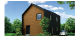
casa sole / カーサソーレ 快適で経済的な暮らしが実現する家