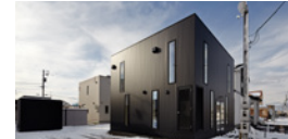
casa nord / カーサノルド -20°Cでも快適な住まいを実現した家