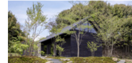
casa amare / カーサアマレ 伝統美から生まれた愛すべき日本の家