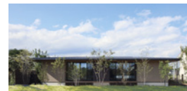
casa piatto / カーサピアット いつまでも心地よい、永久満足の平屋